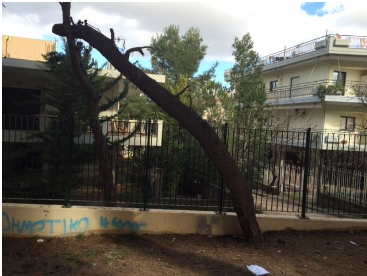
Περίπτωση 1 α